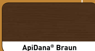
ApiDana ® Braun