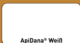
ApiDana ® Weiß