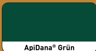
ApiDana ® Grün