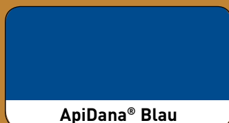
ApiDana ® Blau