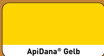
ApiDana ® Gelb